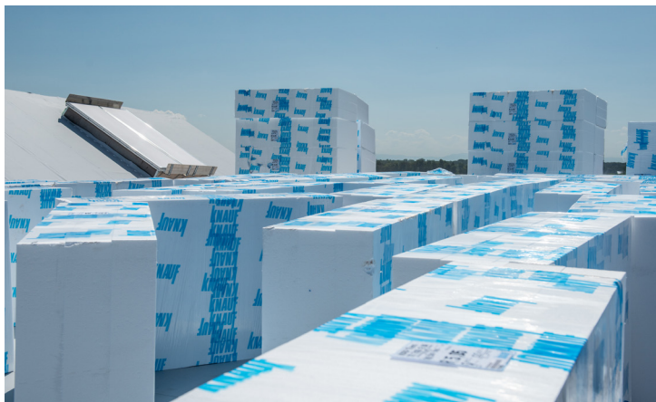
Le PSE, un matériau largement utilisé dans le secteur du Bâtiment.

Ce service permet de récupérer, sur sites, leurs déchets propres de PSE (hors déconstruction), commercialisés ou non par Knauf, pour les introduire dans une filière de collecte et de recyclage responsable, fiable, garante de la traçabilité des matériaux . Cette solution valorise ces ressources en leur donnant une seconde vie, pour un véritable modèle d'économie circulaire vertueux.