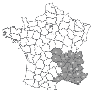
Les départements couverts par la phase pilote de Knauf Circular®.

Alors que la loi sur l'économie circulaire a été votée le 21 janvier 2020 par l'Assemblée Nationale, le Groupe Knauf, leader mondial de la transformation du polystyrène expansé (PSE), donne une nouvelle vie aux chutes, emballages et calages en PSE grâce à son service dédié Knauf Circular® .