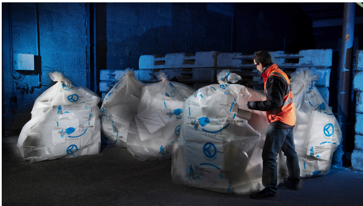
Knauf Circular® : un modèle d'économie circulaire vertueux avec la collecte et le recyclage du PSE.